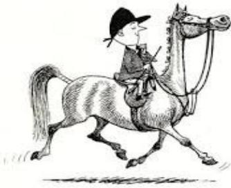
A SHARP TURNOUT IS OF FIRST IMPORTANCE.

6 x Einzelunterricht jeweils \frac{1}{2} Std. (die Pferde sind bereits warm geritten).