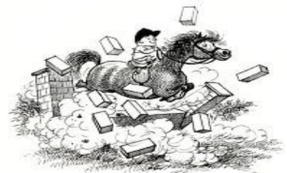
TAKE-OFF JUST RIGHT

VM-Springen: 21.06. (alle Vereinsmitglieder können teilnehmen)